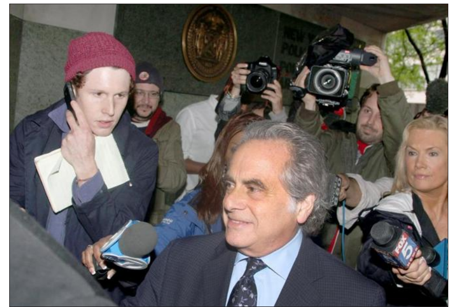
« La bataille ne fait que commencer », précise Benjamin Brafman qui a défendu notamment Michael Jackson.

La défense compte s'organiser notamment autour de l'emploi du temps de samedi de DSK. Ses avocats assurent par exemple que celui-ci n'a pas voulu s'enfuir mais qu'il a