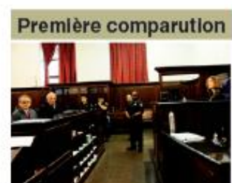
Interpellé le 14 mai, Dominique Strauss-Kahn s'est vu signifier sept chefs d'accusation, lundi au tribunal pénal de Manhattan

Le directeur général du FMI est entre autre accusé d'acte sexuel criminel, tentative de viol et séquestration