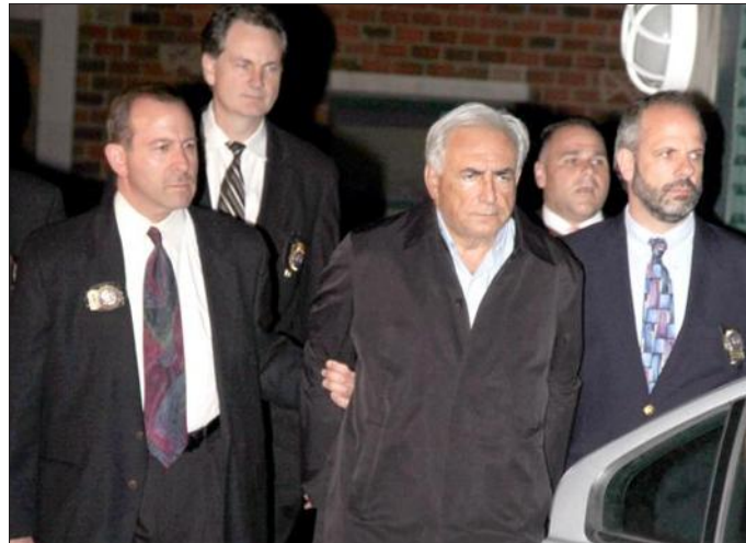
Des images qui ont fait le tour du monde.