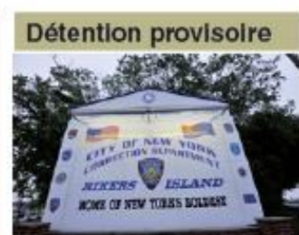
DSK, dont la libération sous caution a été refusée par la juge Jackson, est incarcéré à la prison de Rikers Island