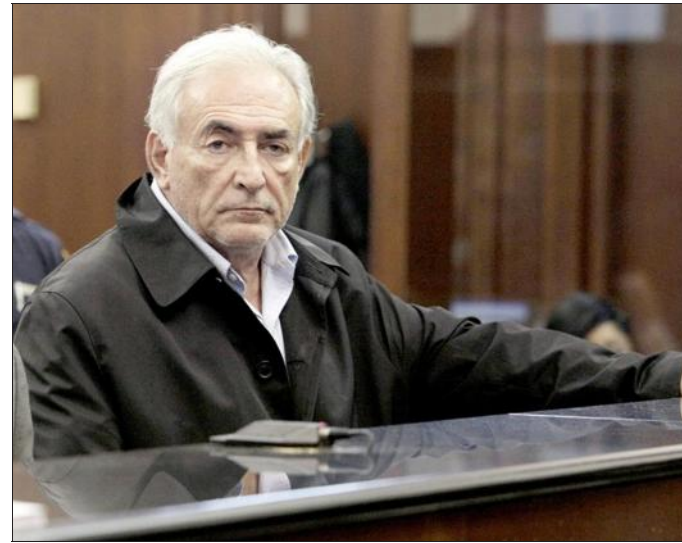
DSK attend maintenant la décision de la chambre d'accusation.

ce qu'il n'aurait pas fait s'il était en fuite. Des prélèvements ADN supplémentaires ont été effectués dimanche sur DSK, pour éventuellement détecter des traces de violence. La défense s'est engagée à produire en temps voulu le témoignage de la personne avec qui DSK aurait déjeuné.